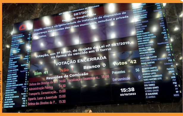
Projeto que reforça segurança nas escolas é aprovado de forma definitiva. (03/10/2023)

3. Ministério Público: criação do Núcleo Interinstitucional de Proteção Escolar, com o objetivo de discutir ações e protocolos de prevenção à violência e de fortalecimento à rede de proteção às unidades de ensino públicas e privadas de Minas Gerais.